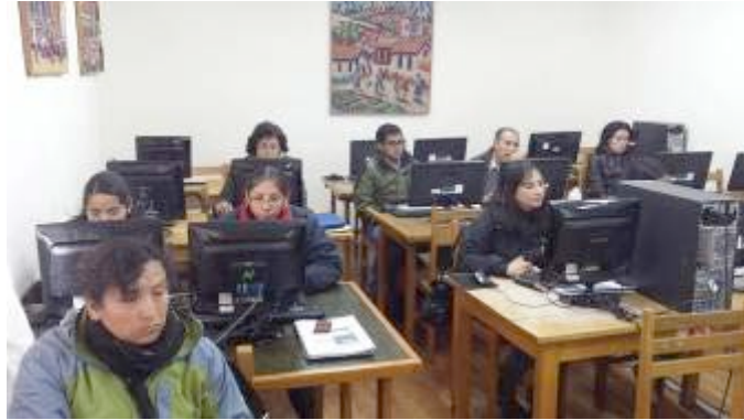
Sesión 7: Sala de cómputo del Centro Guamán Poma de Ayala

Una de las restricciones que enfrentan las municipalidades son los limitados recursos económicos destinados para la contratación de personal que le permita una adecuada gestión del territorio para atender las necesidades en temas de prevención del riesgo de desastres en el marco del planeamiento urbano, el desarrollo de proyectos y la capacitación de la población 2 . Por ello, encontramos que el diseño de la intervención es lógico, coherente y relevante para atender la problemática identificada pues se plantea como un aporte en la consolidación institucional de los municipios al desarrollar actividades de distinto nivel y alcance orientadas a fortalecer las capacidades de gestión municipal, así como a lograr una sensibilización sobre la importancia de la gestión de riesgos y saneamiento físico-legal de las viviendas como herramientas de inclusión social.