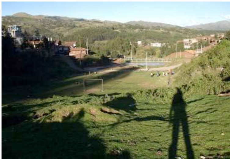
Áreas públicas protegidas por los vecinos brindan una mayor calidad de vida a la comunidad en los barrios populares.

Los espacios públicos recuperados han creado nuevas áreas verdes, empleando al mismo tiempo variables de mitigación de riesgos de desastre, que son valorados como modelos replicables para otras zonas de la ciudad que cuentan con espacios deteriorados, como lo eran antes los intervenidos y transformados en el marco de este proyecto.