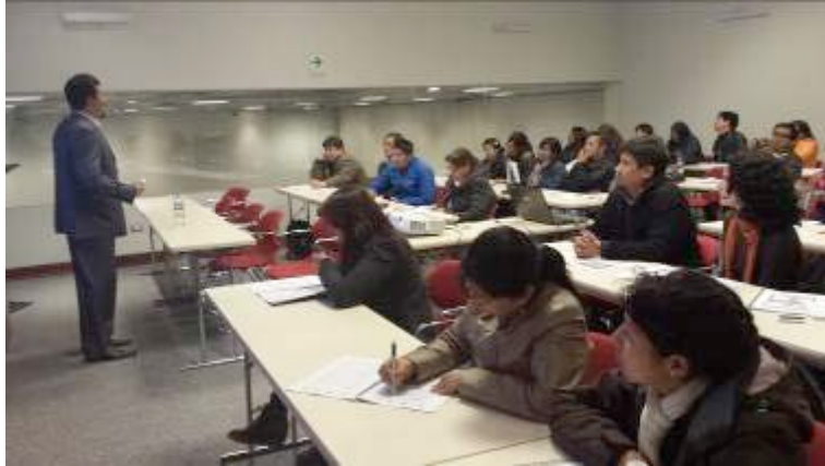
Diplomado de Gestión de ciudad y del riesgo de desastres. Sesión 9. Módulo 5. Centro de Convenciones de la Municipalidad Provincial de Cusco.

Finalmente hemos podido indagar sobre el acceso de los destinatarios a las actividades de la intervención del proyecto, encontrando que la apertura y convocatoria ha sido grande, como ha sido el caso de la convocatoria del Diplomado de Gestión de la ciudad y del riesgo de desastres, que contó con la participación de funcionarios de la Municipalidad de Echarati, que dista 7 horas de la ciudad de Cusco. Así mismo en el proceso de capacitación para alfabetización informática, destinado a brindar acceso a la información en la web no ha podido ampliarse más allá de lo previsto por los recursos disponibles del proyecto.