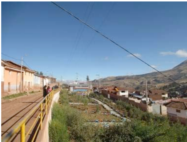
Vista de área de aporte mejorada con el proyecto, destinada al uso Recreacional y construida con participación de los vecinos de la APV