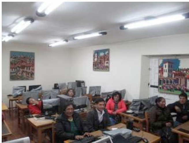
Entrevista con algunos de los participantes del Curso de Alfabetización informática.

Los roles que se definen entre el hombre y la mujer en una economía campesina o en los barrios populares urbanos es con frecuencia la mejor forma de sobrevivencia que tienen estas familias marginadas. En los barrios populares ante la falta de trabajo de los esposos, o por problemas sociales que desestructuran la familia, son muchas mujeres las jefas del hogar. Otros datos son la gran cantidad de organizaciones de mujeres que emprenden acciones de asistencia social en sus asentamientos humanos, o como la mujer se convierte en emprendedoras de microempresas y se asocian.