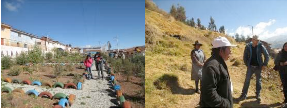
Mejoramiento de espacios públicos y prevención de riesgos en APV El Pedregal

tecnologías que no generen impactos negativos en el medio ambiente en los procesos de mejoramiento de sus viviendas.