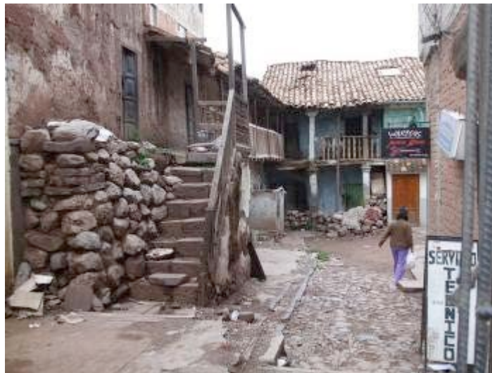
Viviendas deterioradas e insalubres. Tugurio en el Centro Histórico de Cusco.

Encontramos que las necesidades de la población beneficiaria, como sociedad civil, apuntan fuertemente al empoderamiento de su capacidad para incidir en las políticas públicas y ser gestores para la mejora de la calidad del hábitat, particularmente en espacios públicos, vivienda popular, gestión del riesgo de desastres e inclusión social, en temas de saneamiento físico legal de la propiedad y gestión del territorio con atención a los espacios públicos.