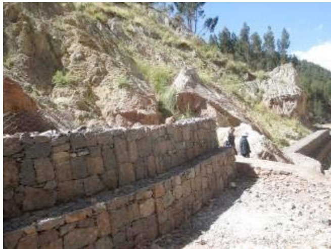
Muros de contención y gaviones en la zona de Saphy, Cusco.

En las visitas de campo y entrevistas realizadas ha quedado firmemente establecido que el trabajo ejecutado por el equipo responsable del proyecto se ha hecho en estrecha coordinación con los vecinos y dirigencias, asimismo cuando se ha trabajado con funcionarios de la municipalidad en las múltiples acciones ejecutadas. Más aún, hubiera sido imposible avanzar hacia los tres resultados alcanzados, así como las múltiples actividades que supusieron sin una coordinación entre los diferentes actores para obtener los logros del proyecto. De esto se da cuenta en los informes entregados por Guamán Poma y así lo han expresado las autoridades y funcionarios de la municipalidad del Cusco, en particular los correspondientes a la Sub Gerencia de Ordenamiento Territorial y los profesionales de la gerencia de Medio Ambiente y Limpieza pública del municipio con los que conjuntamente se han hecho la arborización de 5,760 plántones sembrados en los espacios públicos mejorados y en las obras físicas de prevención de riesgos en la Quebrada de Saphy.