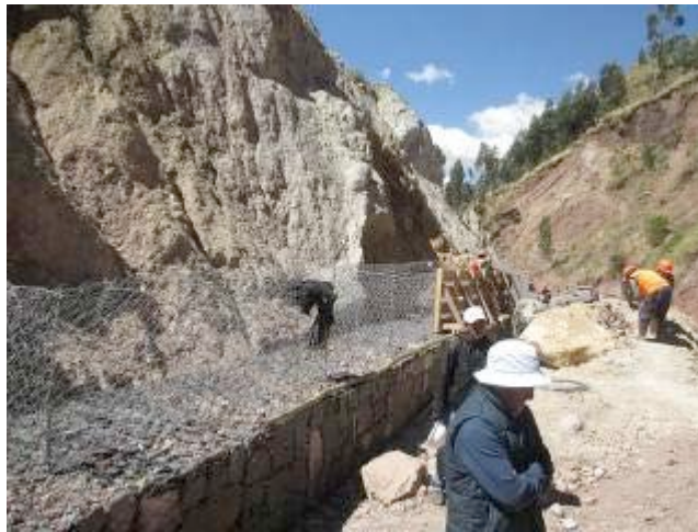
Construcción de gaviones de piedra y malla de acero. Quebrada de Muyuorcco.

del desarrollo urbano manifestaron que el mismo contribuye a afirmar las políticas públicas en este campo.