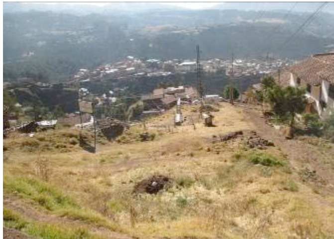
Terreno en la zona nor occidental de Cusco calificado como Inapropiado para el uso de vivienda por su riesgosa ubicación.

Se logró sensibilizar a sectores de población del distrito de Cusco respecto de la importancia de gestionar una ciudad y una vivienda segura, y más bien retomar los procesos inconclusos de habilitaciones y saneamiento urbano de sus habilitaciones, para así estar en condiciones de obtener servicios urbanos de los que carecen. Para no construir en terrenos de ladera. Al contar con habilitaciones urbanas aprobadas y regularizadas por el municipio, se pueden tramitar sin problemas u objeciones proyectos de equipamientos de salud y educación en lo que podría considerarse un efecto parcial del proyecto cuando se concreten. En todo caso, es un proceso en marcha de mediano y largo plazo, que atiende a las nuevas normas del sistema de inversión pública SNIP que ahora obligan a la población a asumir con mayor formalidad en la tramitación de la nueva obra pública, de evaluar su rol y compromiso más activo.