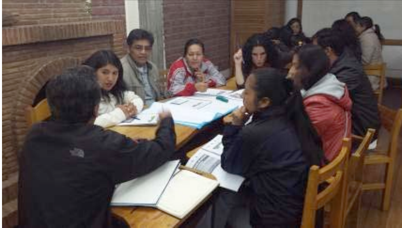
Grupo de participantes del diplomado de Gestión de la Ciudad Y del riesgo de desastres. Auditorio de la Municipalidad de Cusco.

Atendiendo a la problemática de las dimensiones de género, aparece importante la capacitación y participación de las mujeres. De todos los eventos desarrollados más del 60 % de las personas capacitadas fueron mujeres lo que apunta a su creciente empoderamiento dentro de la sociedad, particularmente con el aporte de jóvenes profesionales.