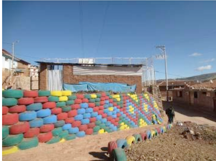
Muro construido con neumáticos reciclados en APV El Pedregal.

Concluimos en que hemos encontrado coherencia entre los objetivos institucionales, los objetivos del proyecto y la metodología que ha utilizado el Centro Guamán Poma de Ayala para la ejecución del proyecto.