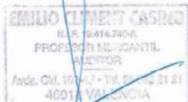
casino Nº 6-593

En nuestra opinión, las cuentas anuales reformuladas abreviadas adjuntas expresan, en todos los aspectos significativos, la imagen fiel del patrimonio y de la situación financiera de la ASOCIACION PETJADES , a 31 de diciembre de 2015, así como de los resultados correspondientes al ejercicio anual terminado en dicha fecha, de conformidad con el marco normativo de información financiera que resulta de aplicación, y en particular, con los principios y criterios contables contenidos en el mismo.