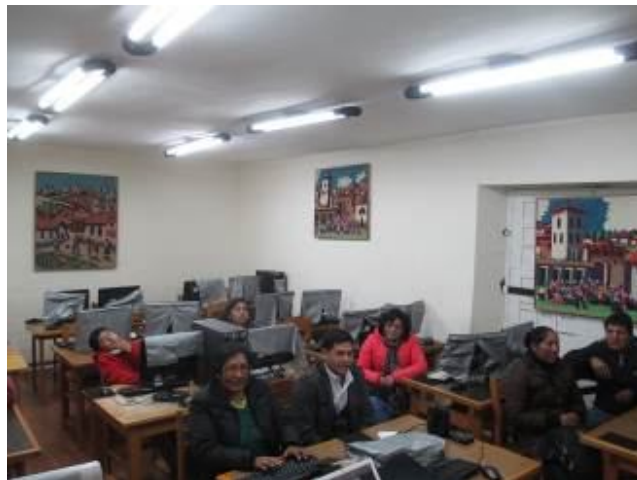
Entrevista con algunos de los participantes del Curso de Alfabetización informática.

Los roles que se definen entre el hombre y la mujer en una economía campesina o en los barrios populares urbanos es con frecuencia la mejor forma de sobrevivencia que tienen estas familias marginadas. En los barrios populares ante la falta de trabajo de los esposos, o por problemas sociales que desestructuran la familia, son muchas mujeres las jefas del hogar. Otros datos son la gran cantidad de organizaciones de mujeres que emprenden acciones de asistencia social en sus asentamientos humanos, o como la mujer se convierte en emprendedoras de microempresas y se asocian.