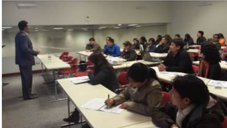
Diplomado de Gestión de ciudad y del riesgo de desastres. Sesión 9. Módulo 5. Centro de Convenciones de la Municipalidad Provincial de Cusco.