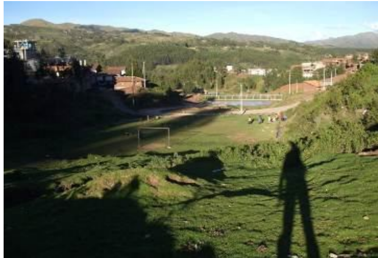
Áreas públicas protegidas por los vecinos brindan una mayor calidad de vida a la comunidad en los barrios populares.

Simultáneamente ha promovido desde las organizaciones sociales de los barrios, identificadas con el trabajo realizado por el Centro Guamán Poma durante muchos años, su intervención como actores en la gestión de riesgos sobre el territorio. Todo esto como un esfuerzo compartido por lograr mejoras de las deficientes condiciones de su vida. Esto constituye una evidente contribución del proyecto al desarrollo social, económico, institucional y organizativo de la Zona Nor Occidental, donde se seguirá trabajando desde las dirigencias vecinales con los patrones y perspectivas que han inspirado este proyecto. Creemos que esto garantiza su continuidad en la prevención del riesgo y la defensa de los espacios públicos que vienen conectados con la mayor toma de conciencia y compromiso de los vecinos y vecinas de estos barrios, particularmente las nuevas generaciones de jóvenes, por defender y proteger el medio ambiente. De este modo, el aporte del proyecto se convierte en un impulso para un salto generacional hacia una mayor calidad de vida de las familias sujetos de derechos, tanto en temas de mayor confort ambiental, de previsión para enfrentar el tema del riesgo físico, como de mejorar las relaciones de sus ocupantes.