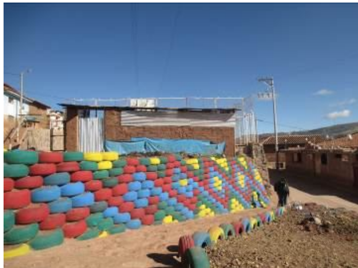
Muro construido con neumáticos reciclados en APV El Pedregal.

Por otro lado, en la perspectiva del trabajo institucional a largo plazo del Centro Guamán Poma de Ayala esta intervención tiene que leerse también desde el marco de la implementación de la Agenda de Desarrollo de la Zona Nor occidental elaborada por el Centro Guamán Poma en el año 2009 y la actualización del Plan de Desarrollo Urbano de la provincia de Cusco trabajado por la Municipalidad Provincial de Cusco entre los años 2013 al 2014; lo que incluyó la transferencia de mapas temáticos al municipio del Cusco. Este material producido por el equipo de Guamán Poma lo utiliza actualmente el equipo de profesionales de la Sub Gerencia de Ordenamiento Territorial de la Municipalidad Provincial de Cusco. Asimismo hacen uso de los reportes que abordan el tema de riesgo e indicadores urbanos referidos a saneamiento básico de la propiedad en la zona noroccidental de la ciudad de Cusco, que también fueron transferidos a la municipalidad.