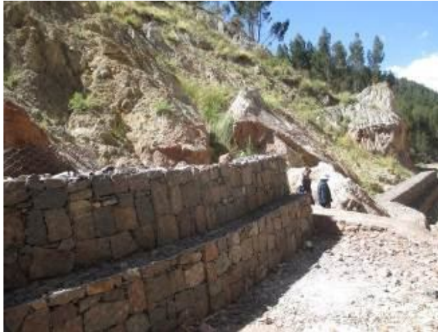
Muros de contención y gaviones en la zona de Saphy, Cusco.

pública del municipio con los que conjuntamente se han hecho la arborización de 5,760 plántones sembrados en los espacios públicos mejorados y en las obras físicas de prevención de riesgos en la Quebrada de Saphy.