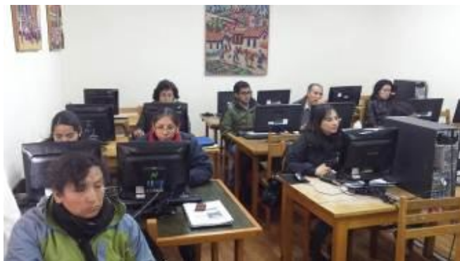
Sesión 7: Sala de cómputo del Centro Guamán Poma de Ayala

Una de las restricciones que enfrentan las municipalidades son los limitados recursos económicos destinados para la contratación de personal que le permita una adecuada gestión del territorio para atender las necesidades en temas de prevención del riesgo de desastres en el