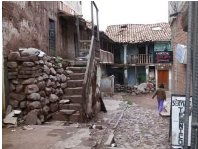
Viviendas deterioradas e insalubres. Tugurio en el Centro Histórico de Cusco.

Encontramos que las necesidades de la población beneficiaria, como sociedad civil, apuntan fuertemente al empoderamiento de su capacidad para incidir en las políticas públicas y ser gestores para la mejora de la calidad del hábitat, particularmente en espacios públicos, vivienda popular, gestión del riesgo de desastres e inclusión social, en temas de saneamiento físico legal de la propiedad y gestión del territorio con atención a los espacios públicos.