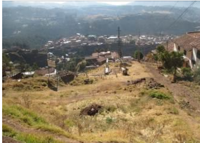
Terreno en la zona nor occidental de Cusco calificado como Inapropiado para el uso de vivienda por su riesgosa ubicación.

Los materiales de capacitación revisados y especialmente las conversaciones sostenidas durante las visitas de campo dan cuenta de los procesos vividos en el desarrollo del proyecto muestran que en el trabajo realizado con familias, se ha logrado cambios positivos, no sólo en temas de mejoramiento de las condiciones físicas y de habitabilidad de la vivienda, sino además en la promoción de cambios positivos en actitudes frente a las temáticas ambientales y de convivencia familiar.