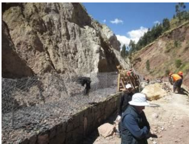
Construcción de gaviones de piedra y malla de acero. Quebrada de Muyuorcco.

Específicamente el manual de procedimientos sobre saneamiento físico legal de asentamientos humanos constituye un instrumento que la municipalidad del Cusco ha hecho suyo y se alinea plenamente con sus intereses y políticas. Durante la evaluación los funcionarios responsables del desarrollo urbano manifestaron que el mismo contribuye a afirmar las políticas públicas en este campo.