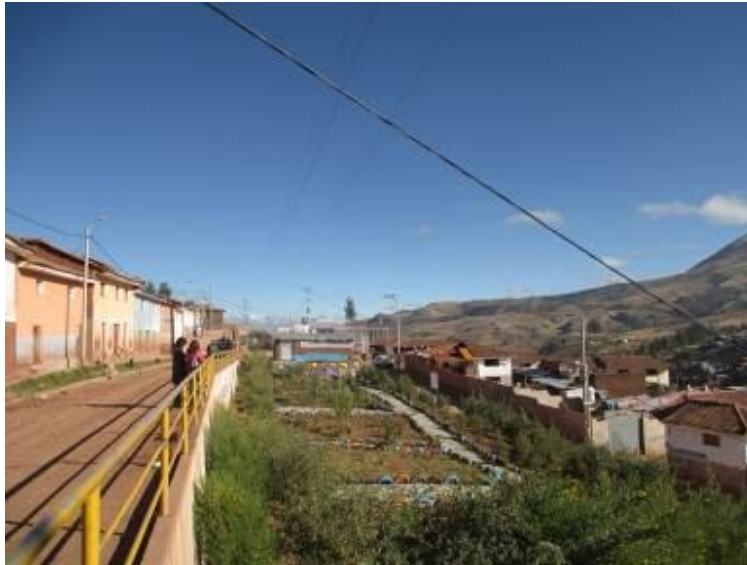
Vista de área de aporte mejorada con el proyecto, destinada al uso Recreacional y construida con participación de los vecinos de la APV El Pedregal y la Municipalidad del Cusco.

En cuanto al Estado Peruano, su conexión con el proyecto se dio en tanto se plantearon propuestas de incidencia política y se esperó una participación activa a partir de políticas de apoyo y financiamiento a los temas de vivienda para los sectores de bajos ingresos. Estas se anunciaron pero no fueron aplicadas en el Cusco. Se cuenta sí con un importante cuerpo de nuevas normas sobre seguridad (en el marco de la Defensa Civil y legislación sobre ambiente) que sin embargo no se aplican por falta de voluntad política de las autoridades nacionales que deslindan su papel en las instancias regionales y municipales en el marco de un proceso de descentralización que ha transferido muchas responsabilidades del gobierno central a instancias menores, pero sin acompañarlas de asesoría, ni recursos financieros suficientes.