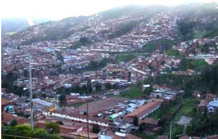
Asentamientos Humanos, Asociaciones Pro vivienda y Pueblos Jóvenes ubicados en las laderas de la ciudad del Cusco.

El proceso de descentralización nacional emprendido el año 2002 y que fuera recibido con entusiasmo en la región de Cusco, sin embargo se ha detenido, y en el proceso se ha podido apreciar que no se vinculan ni coordinan los esfuerzos, recursos y proyectos que ejecutan en la ciudad, el valle y la región entre los entes estatales responsables de nivel regional y local, ni éstos con los nacionales. Se percibe un proceso desarticulado y poco planificado, sin una clara redistribución del poder, competencia que trae duplicidad de esfuerzos e ineficiencia en la atención a los sectores más necesitados que aparecen como un mercado para políticas populistas.