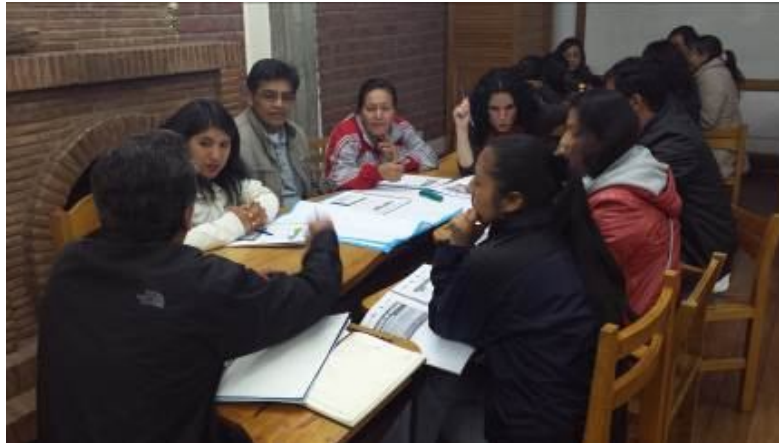
Grupo de participantes del diplomado de Gestión de la Ciudad Y del riesgo de desastres. Auditorio de la Municipalidad de Cusco.

estilo de trabajo y la capacitación y sensibilización que el proyecto ha trabajado y que se expresa, por ejemplo en sus materiales de capacitación y difusión, en las convocatorias y participación en las actividades de capacitación de la población así como de dirigentes buscando la equidad de género. Se valora como altamente conveniente por los beneficiarios el trabajo diseñado a combatir y superar las condiciones de exclusión de la población por razones de género.