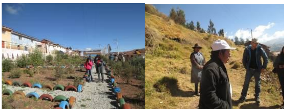
Mejoramiento de espacios públicos y prevención de riesgos en APV El Pedregal